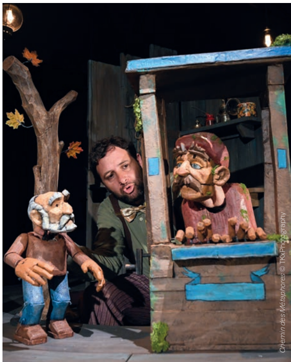
Chemin des Métaphores

Trio entre une violoncelliste, un iguane et un robot qui aime jouer, qui manipule des peluches et les fait danser.